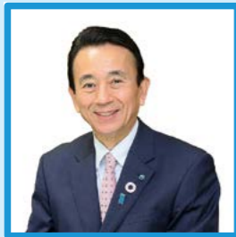
鈴木康友 浜松市長