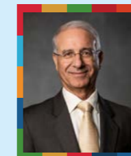
ラシャッド・ブフラル 駐日モロッコ王国 特命全権大使