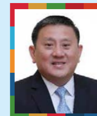
ビーター・タン・ ハイ・チュアン 駐日シンガポール 共和国特命全権大使