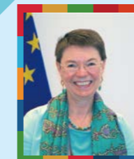
巴トリア・フロア 前駐日欧州連合 特命全権大使